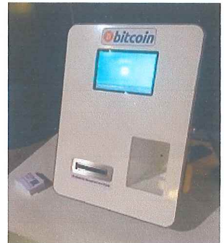
Abbildung 1: Bitcoin-Geldautomat. Mit Bargeld können Bitcoins gezogen werden, die unmittelbar auf ein Wallet (via QR-Code) überwiesen werden.

Um unserem vorausseilenden Ruf als „Technologie-Stadt“ gerecht zu werden, ergeht daher folgender Antrag :