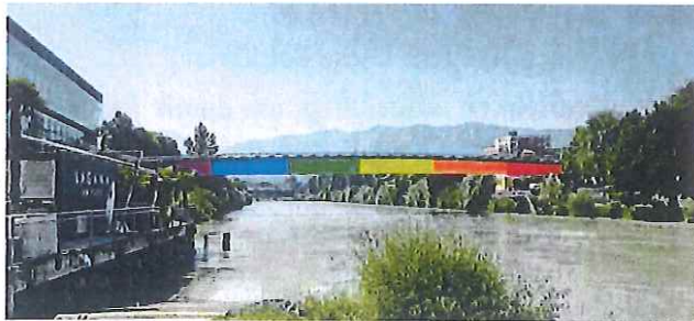
Fotomontage 1: Mögliche Farbdarstellung des Regenbogens