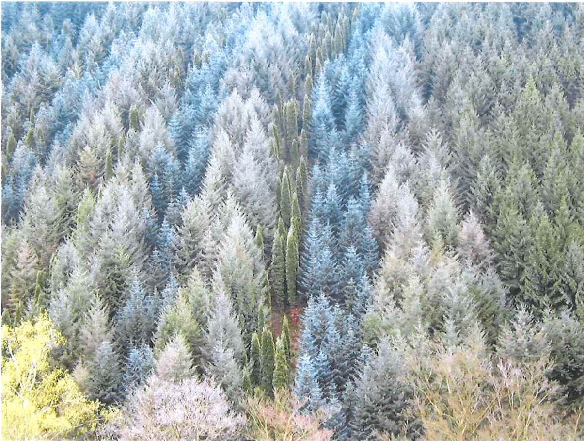
Illustration 1: Arboretum Burgholz (DE) fwzVgv commons.wikimedia.org