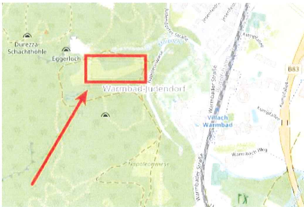
Illustration 2: Schützenwiese als möglicher Standort. Grafik fwzVgv www.osm.org