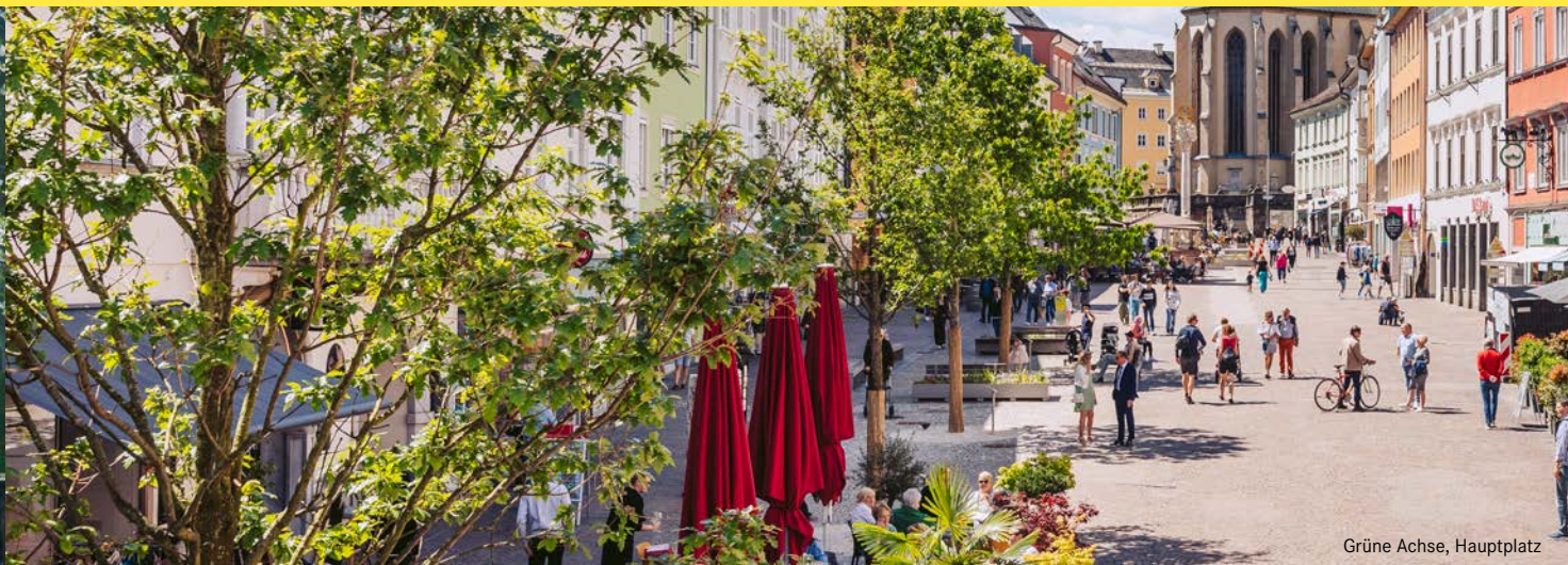
Grüne Achse, Hauptplatz